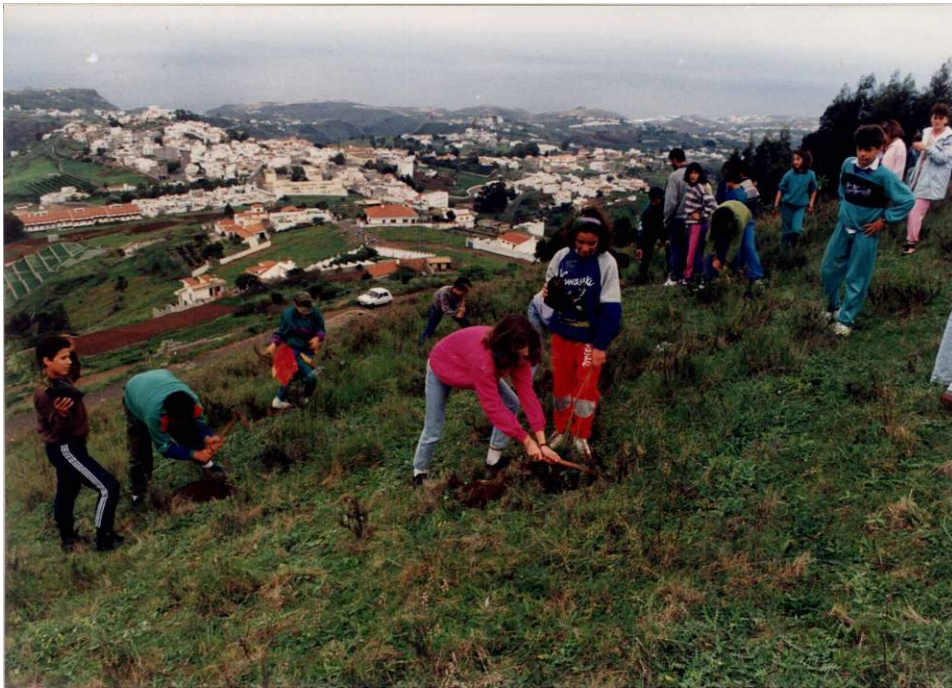
Foto 2: Grupo de alumnos/as del C. Martín Cobos (hoy CEIP Villa de Fargas), con integrantes de La Vinca como monitores/as, plantando en las laderas de la cara norte de la Montaña de Fargas (diciembre de 1987).

Parainfo de la Universidad de Las Palmas de Gran Canaria - 23 al 25 de noviembre de 2011