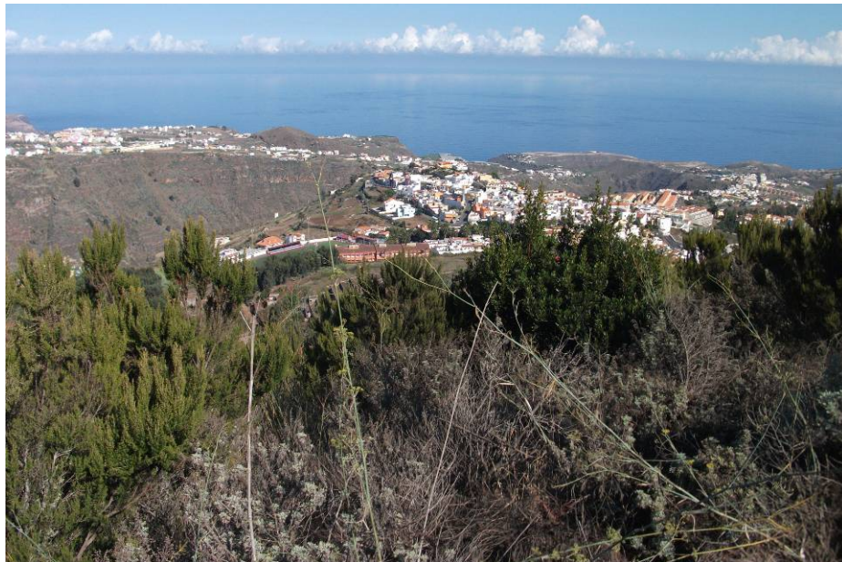
Foto 3: Imagen actual, 24 años después de la misma zona de actuación en la Montaña de Fargas (octubre 2011)