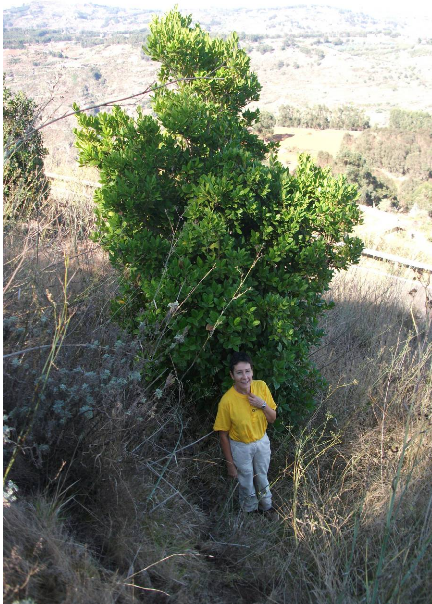
Foto 4: Se puede observar un ejemplar de Palo Blanco, 24 años después de ser plantado, que ya supera los cuatro metros de altura (octubre 2011)

Paraninfo de la Universidad de Las Palmas de Gran Canaria - 23 al 25 de noviembre de 2011